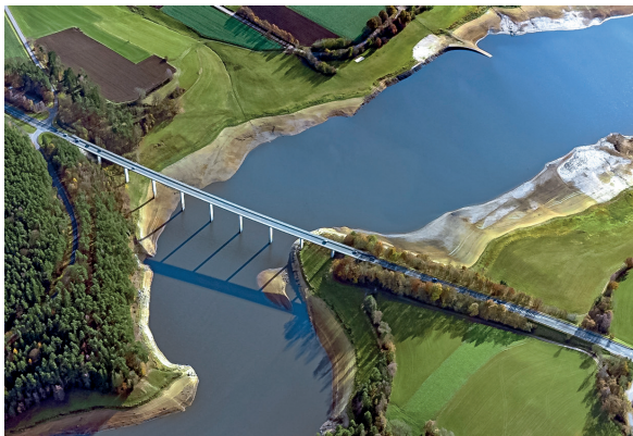
Archivbild: Absenkung See 2016

Insbesondere der Sauerstoff und die Wassertemperatur sind hier wichtige Einflussgrößen für die im See verbleibenden Fische. Fachlich beratend steht hier zudem die Fachberatung für Fischerei des Bezirks Oberpfalz zur Seite. Sollte der Sauerstoffgehalt im See zu weit sinken, haben die umliegenden Kommunen bereits ihre Unterstützung angekündigt - beispielsweise bei der Belüftung mit Pumpen. Somit kann die Absenkung des Eixendorfer Sees so schonend wie möglich für das sensible Ökosystem durchgeführt werden.